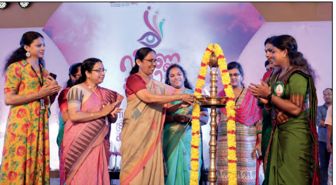
വർണ്ണാഭിമുഖീകരണ നിരൂപകിട്ടേകി 2019 ഉദ്ഘാടന വേളയിൽ

തിരുവനന്തപുരം കണ്ണൂരും മനസിനും ഏഴുഴക് നിറച്ച് രാജ്യത്തെ ആദ്യ ട്രാൻസ്ജെൻഡർ കലോത്സവമായ 'വർണ്ണാഭിമുഖീകരണ നിരൂപകിട്ടേകി' 2019 ന് അനന്തപുരിയിൽ വർണ്ണാഭമായ തുടക്കം. ചാല ഗവ.മോഡൽ ബോയ്സ് ഹയർസെക്കന്ററി സ്കൂളിൽ ആരംഭിച്ച കലാമേള ആരോഗ്യ-സാമൂഹികനീതി, വനിതാ-ശിശു വികസന വകുപ്പ് മന്ത്രി കെ.കെ ശൈലജ ഉദ്ഘാടനം ചെയ്തു. ആണം പെണ്ണും പോലെ ട്രാൻസ്ജെൻഡർ ഒരു യാഥാർത്ഥ്യമാണ്. 'നിങ്ങളിൽ ഞങ്ങളുണ്ടെന്ന്' ഈ സമൂഹത്തെ പഠിപ്പിക്കുകയാണ് ലക്ഷ്യം. സർക്കാരിന് പരിമിതികളുണ്ട്. പക്ഷേ സമൂഹത്തോടൊപ്പം പഠിപ്പിക്കണം. അന്ധിത്വം മനസിലാക്കി ഈ സമൂഹത്തിൽ നിങ്ങളും തലയുയർത്തി തന്നെ നിൽക്കണമെന്നും കലോത്സവം ഉദ്ഘാടനം ചെയ്ത മന്ത്രി പറഞ്ഞു. സർക്കാരിന്റെ മഴവില്ല് പദ്ധതിക്ക് ക്ഷേമം നിരവധി പ്രവർത്തനങ്ങളാണ് സാമൂഹിക നീതി വകുപ്പ് നടത്തിവരുന്നത്. ട്രാൻസ്ജെൻഡർ സമൂഹത്തെ സ്വയം പര്യാപ്തമാക്കുന്നതിനായുള്ള ശ്രമങ്ങളുടെ ഉദാഹരണമാണ് കലോത്സവമെന്ന്